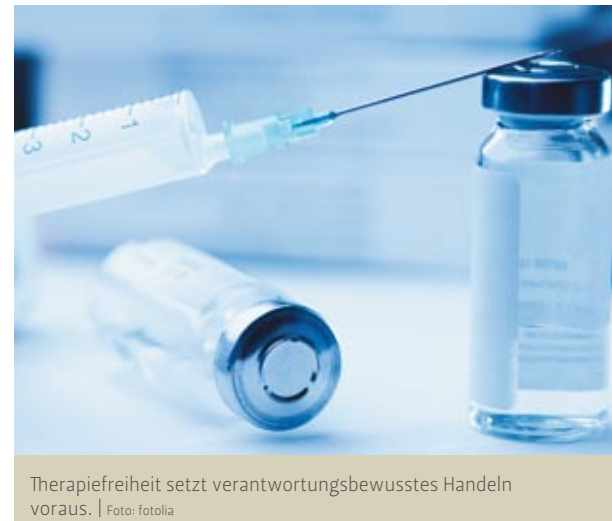
Therapiefreiheit setzt verantwortungsbewusstes Handeln voraus.

Bei allen genannten Einschränkungen verbleibt dem Arzt in Deutschland, insbesondere dem Privatarzt, immer noch ein interessanter Spielraum für therapeutische Entscheidungen. Auch im europäischen Vergleich ist die ärztliche Therapiefreiheit in vielen